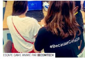
ESCAPE GAME ANIMÉ PAR BECOMTECH

#VivaTech @VivaTech À ne pas manquer aujourd'hui, le programme #WoGiTech : des ateliers de code, des tables rondes et l'expo #womenintech sur le Lab #PositiveBanking de @BNPParibas à #VivaTech 🥰